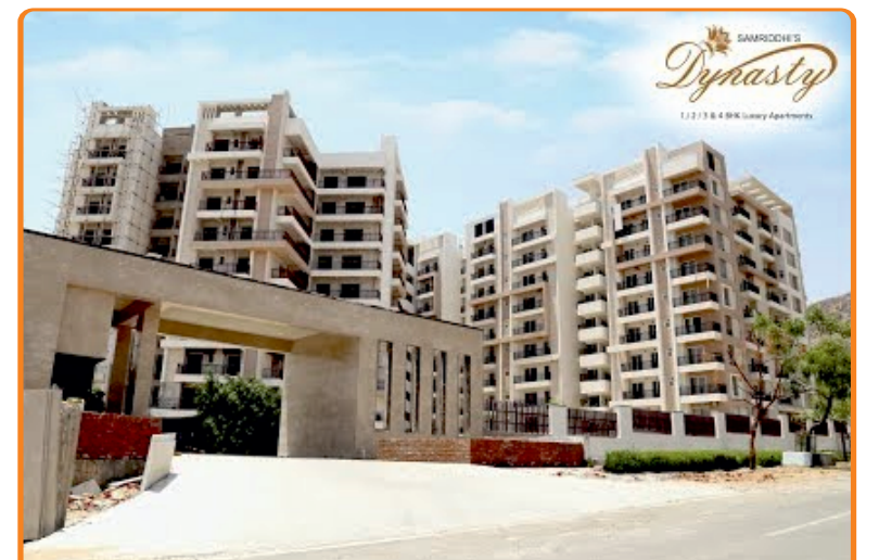
समृद्धि डायनेस्टी, अजमेर