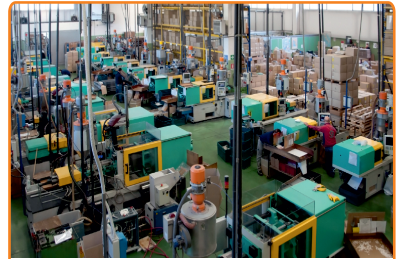
भुर्जी सुपर-टेक इण्डस्ट्रीज, भिवाड़ी