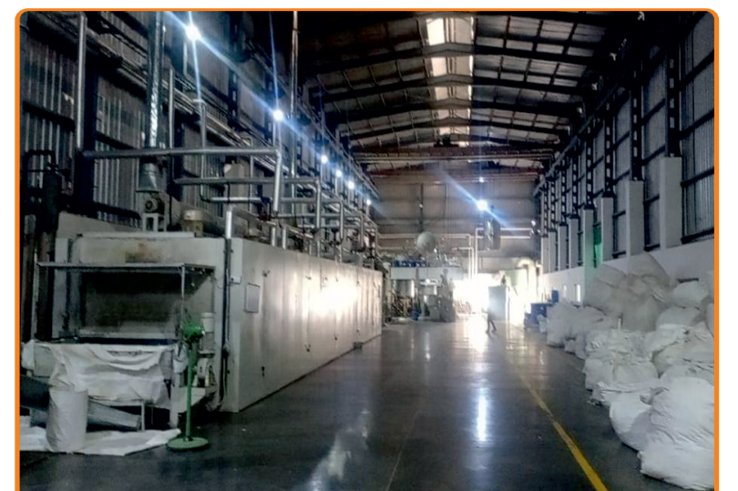
ममता ग्रुप, गुलाबपुरा

प्रधान कार्यालय : 2343 द्वितीय तल, वैशाली नगर, अजमेर (राज.) Visit us at brkgb.com